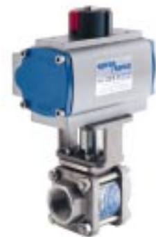
Válvula esférica M10S ISO de 1" con actuador neumático