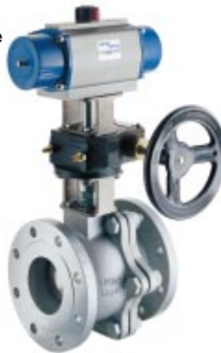
Válvula esférica M31V ISO de 4" con actuador neumático a sin fin y corona