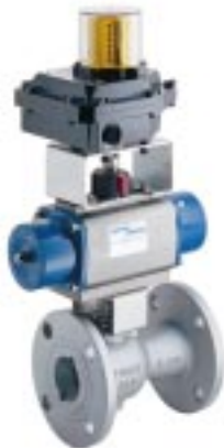
Válvula esférica M40S ISO de 2" con actuador y caja límite de carrera