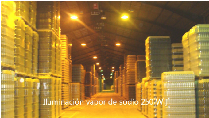
Vapor de sodio